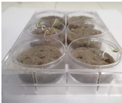
Figure 1. Exemple de biotest, ici sur sable de silice, pour le screening des propriétés allélopathiques d'espèces végétales.

Dans un premier temps, des biotests de screening ont été développés, afin de détecter les espèces potentiellement allélopathiques. Un de ces biotests est réalisé dans des plaques multi-puits, avec différents substrats (milieu gélosé, sable de silice, sol agricole) dans lesquels des tissus végétaux des plantes testées sont incorporés, avant le dépôt de semences d'une plante cible ( Lepidium sativum ) (figure 1). Sur cette dernière, des mesures du taux de germination et de la croissance des plantules sont ensuite effectués.