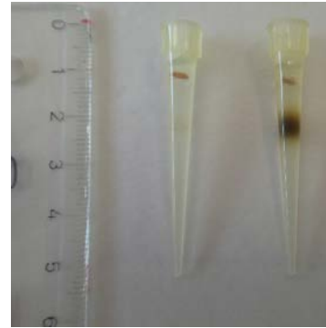
Figure 3. Micro-biotest, de type « sandwich », utilisé pour la mise en évidence des propriétés phyto-toxiques d'extraits végétaux, ou de molécules purifiées, disponibles en très petites quantités.

micro-biotest effectué sur milieu gélosé, en embouts de pipette (figure 3); un biotest réalisable avec de très petites quantités d'extraits [7].