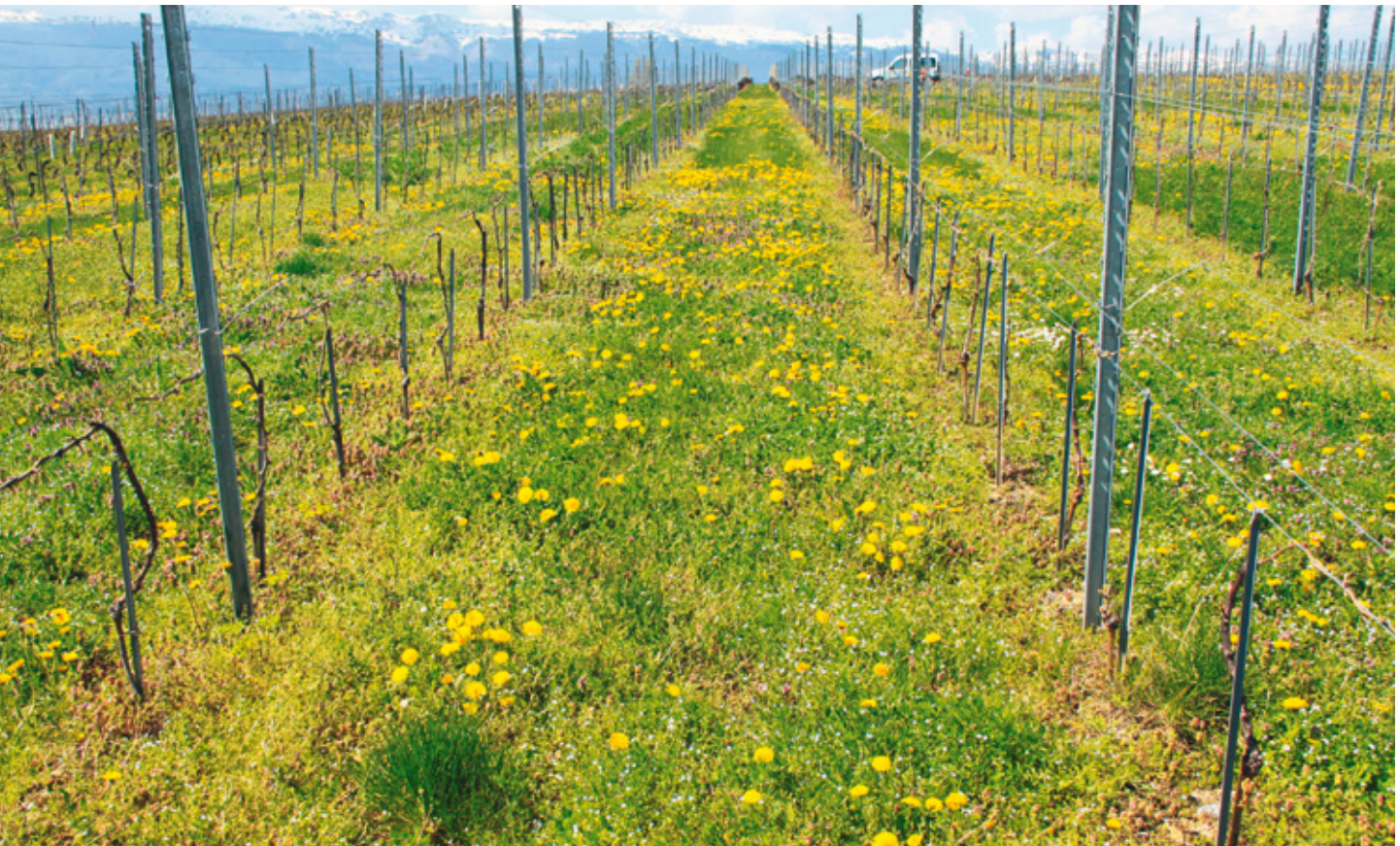
Figure 1 | Vue de la parcelle expérimentale à Bernex (GE).

Renseignements: Nicolas Delabays, e-mail: nicolas.delabays@hesge.ch, tél. +41 22 546 67 59, www.hepia.hesge.ch