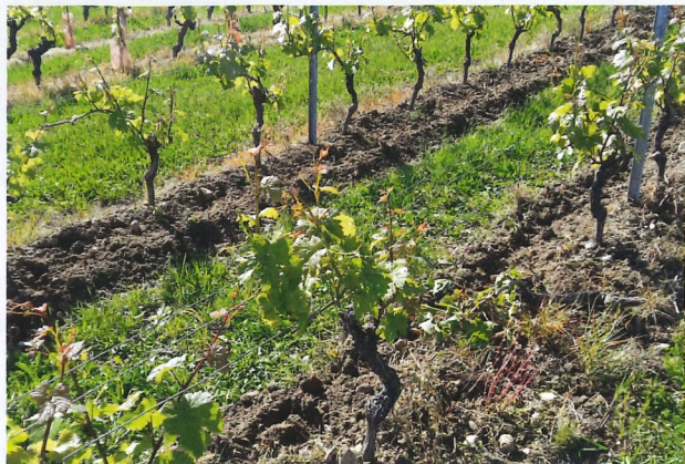
Entretien par les lames intercepts à Essertines-sur-Rolle.

des bases pour le développement d'un semis allélopathique, c'est-à-dire naturellement capable d'inhiber la croissance de la flore non semée, peu concurrentiel pour la vigne et pouvant à terme constituer une alternative supplémentaire aux herbicides sur le cavaillon.