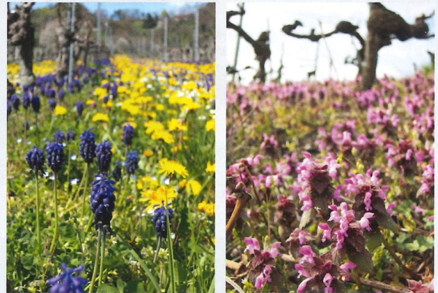
Flore viticole typique: à gauche, muscari à grappe ( Muscari racemosum ) et pissenlit ( Taraxacum officinale ); à droite, lamier rouge ( Lamium purpureum ).